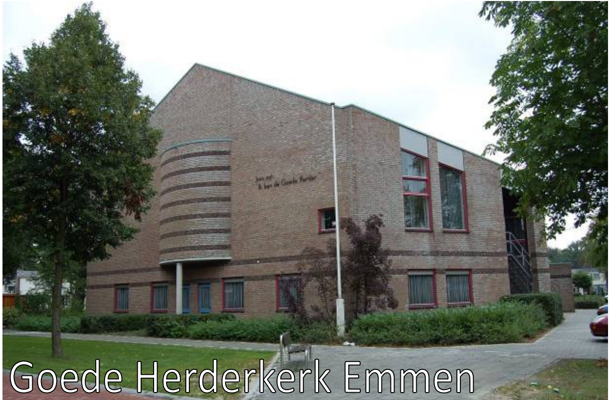
Goede Herderkerk Emmen